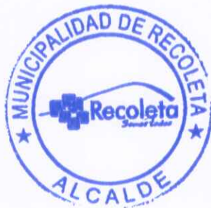
DANIEL JADUE JADUE ALCALDE